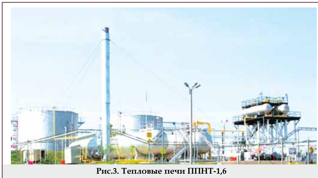
Рис.3. Тепловые печи ППНТ-1,6

Для сжигания ПНГ с целью выработки электроэнергии применяются газопоршневые электростанции АПП-200 мощностью 200 кВт российского производства (рис.4). Она предназначена для работы на попутном газе без предварительной его очистки от сероводорода, что значительно