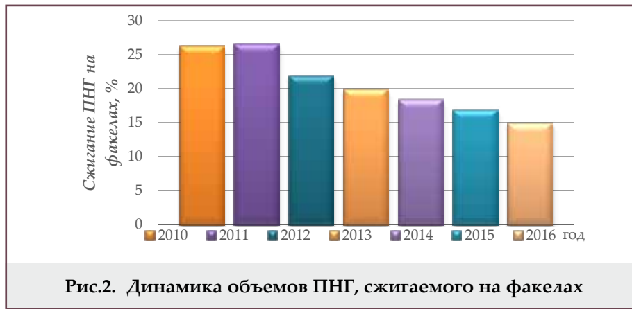
Рис.2. Динамика объемов ПНГ, сжигаемого на факелах

тью на поверхность извлекаются жирные газы (содержание \text{CH}_4=60-85\% , \text{C}_2\text{H}_6=20-35\% ), а с тяжёлой - сухие (содержание \text{CH}_4=85\% , \text{C}_2\text{H}_6=10-15\% ).