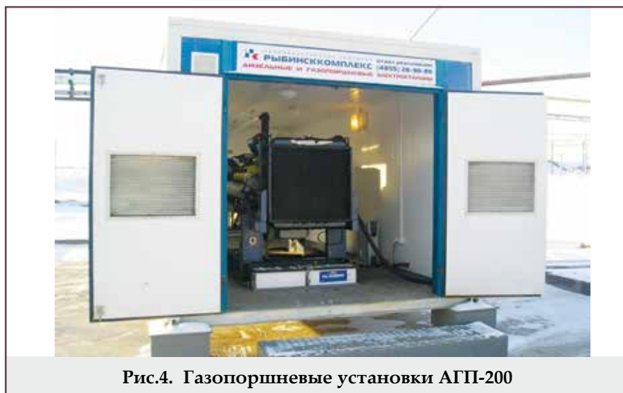
Рис.4. Газопоршневые установки АГП-200

но упрощает работу, и имеет ряд преимуществ: