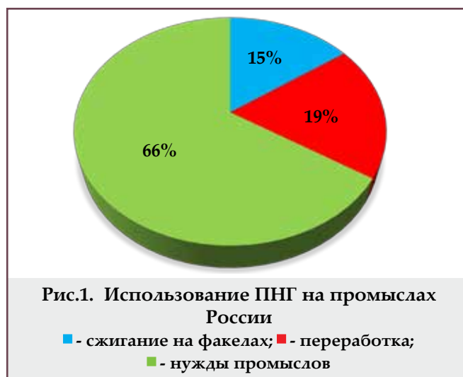
Рис.1. Использование ПНГ на промыслах России

■ - сжигание на факелах; ■ - переработка; ■ - нужды промыслов