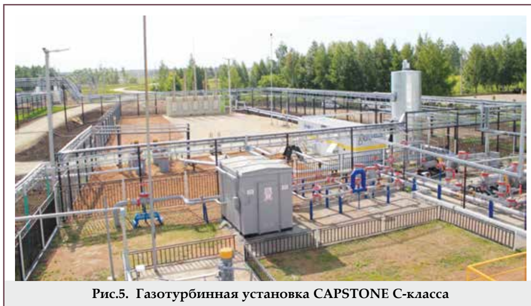
Рис.5. Газотурбинная установка CAPSTONE C-класса