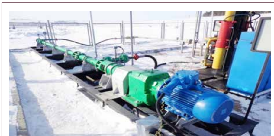
Рис.7. Устройство откачки газа (УОГ) -1

Гомогенизирование и диспергирование ВГС необходимо для получения более однородной мелкодисперсной водогазовой смеси с диаметром пузырьков газа 1-100 мкм в зависимости от проницаемости пород-коллекторов (минимальные размеры для малопроницаемых коллекторов