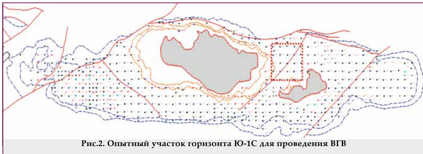
Рис.2. Опытный участок горизонта Ю-1С для проведения ВГВ

ранее исследованиями. Кроме того, использование масловодорастворимых ПАВ в технологиях водогазового воздействия может усиливать процессы взаимодействия нефти и газа [1-9].