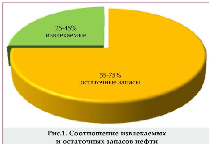
Рис.1. Соотношение извлекаемых и остаточных запасов нефти

В последние годы в мировой практике для интенсификации выработки трудноизвлекаемых запасов нефти все большее применение находит относительно новая технология повышения нефтеотдачи пласта - ВГВ. Эффективность метода ВГВ доказана многими проведенными